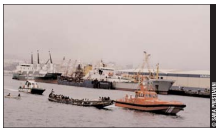
Arrivée d'un «cayuco» après la traversée de la Méditerranée depuis la côte africaine dans le port de Gran Canaria, îles Canaries, en juin 2006.

Or, que ce soit en haute mer ou dans les eaux territoriales de pays tiers, lorsque les migrants sont contraints par FRONTEX à faire demi-tour, aucune procédure d'enregistrement de demande de protection internationale n'est prévue. Pour obtenir la collaboration d'États tiers pour le contrôle des flux migratoires, l'UE coopère et ferme les yeux sur les manquements de ces derniers en matière de protection. La Mauritanie, le Sénégal ou le Maroc, bien que signataires de la Convention de Genève, n'ont pas de procédure nationale de détermination du statut de réfugié. Aussi, les demandes de protection des personnes renvoyées ne pourraient être prises en compte que par le HCR qui n'est pas formellement associé à ces opérations. La Libye n'a même pas ratifié la Convention de Genève et pratique périodiquement des renvois collectifs de migrants vers les régimes africains les plus répressifs. L'UE accepte donc que, dans le cadre d'opérations qu'elle