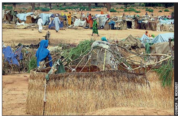
Vue d'ensemble du campement provisoire de Krinding, dans l'Ouest Darfour. Juillet 2004