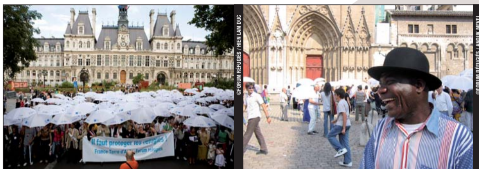
1 000 personnes à Lyon, 2 000 personnes à Paris, merci à tous ! Rendez-vous en 2008...

de sa nationalité, de son appartenance à un certain groupe de la protection de ce pays. Article 1A.2 de la Convention de Genève