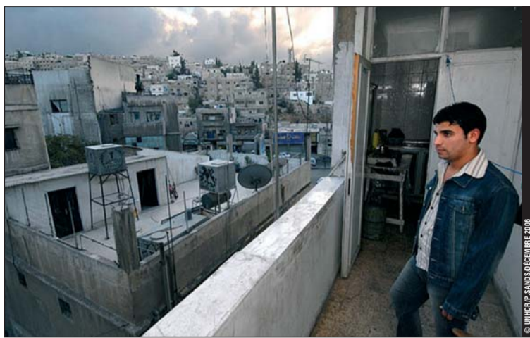
Un réfugié irakien regarde la ville d'Amman. Sur le nombre estimé de deux millions d'Irakiens ayant fui leur pays, quelque 700 000 vivent actuellement en Jordanie, dont une majorité à Amman.

La réinstallation reste donc, à l'heure actuelle, l'unique solution durable per-