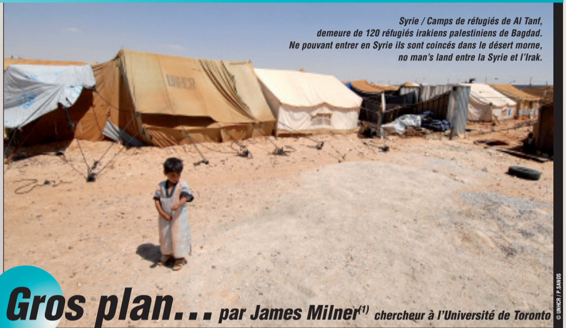
Syrie / Camps de réfugiés de Al Tanf, demeure de 120 réfugiés irakiens palestiniens de Bagdad. Ne pouvant entrer en Syrie ils sont coincés dans le désert morné, no man's land entre la Syrie et l'Irak.

En ces temps d'hyper commentaires et de super méthodes... de grâce un peu de manières ! ■