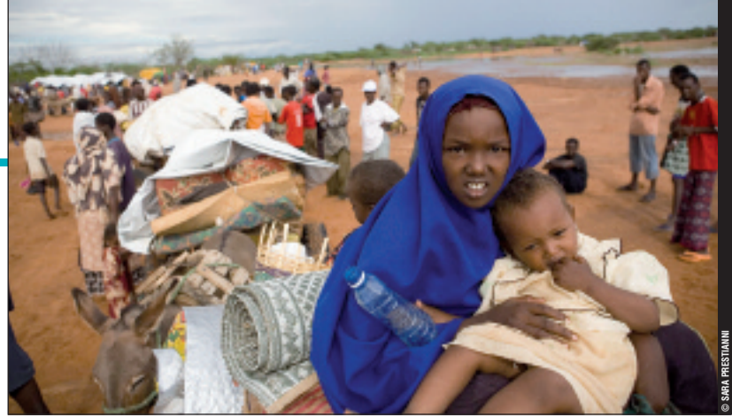
Des inondations dans le nord-est du Kenya à la mi-novembre ont causé des dégâts dans les trois camps de réfugiés du complexe de Dadaab. Plus de 100 000 réfugiés sur les 160 000 qui y sont accueillis ont été affectés par ces inondations.

Les exemples de la Côte d'Ivoire et du Darfour sont assez symptomatiques de ces guerres de demain. Dans le premier cas, à la mort d'Houphouët Boigny une élite en mal de légitimité invente la notion d'Ivoirité en instrumentalisant les fractures identitaires entre "ivoiriens" et "immigrés" sur fond de lutte pour l'accès aux ressources agricoles. Dans le second cas, le