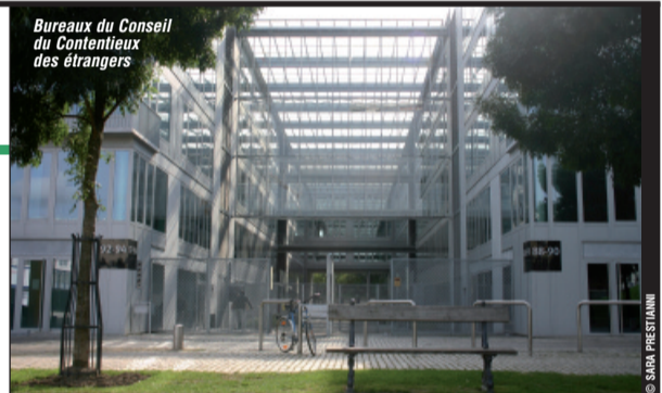
Bureaux du Conseil du Contentieux des étrangers