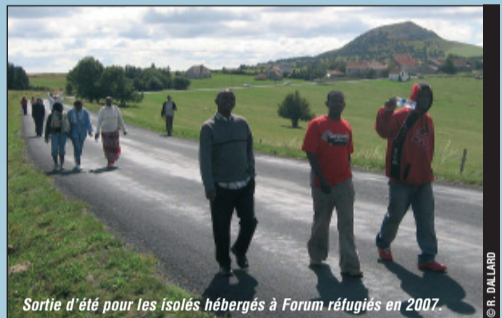
Sortie d'été pour les isolés hébergés à Forum réfugiés en 2007.

Pour la 3 ème année consécutive, un séjour d'été «inter centres» pour les personnes isolées de Forum réfugiés sera organisé en Ardèche. Le projet se nourrit de la découverte du milieu naturel de la région et de la rencontre avec ses habitants. Les années précédentes, chants, danses et théâtre constituaient le socle des activités partagées. Pour ce rendez-vous 2008, nous participerons le dimanche 1 er juin à la quatrième édition de la «Ronde des hameaux», une randonnée pédestre intercommunale mise en place par la commission tourisme du village de Dornas. Cette année le thème de cette «ronde», composée de randonnées des Boutières et de demandeurs d'asile hébergés par l'association, est celui de la rencontre et du voyage. Nous interviendrons à cette occasion sur le thème du droit d'asile et présenterons l'exposition «Dans l'attente...». Entre voyage subi et voyage choisi, ce moment de convivialité devrait permettre de faire évoluer les représentations de chacun sur le sujet et de favoriser le dialogue interculturel. ■