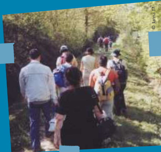
...la vie dans les centres