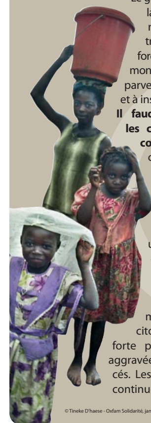
© Tineke D'haese - Oxfam Solidarité, janvier 2006, RDC